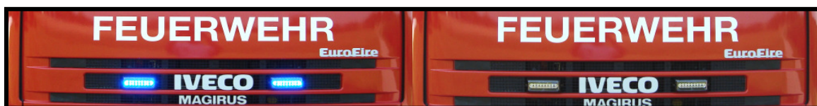
9 Hochleistungs- LED's pro Leuchtenkörper, LED's neuester Generation „Hohe Leuchtkraft“