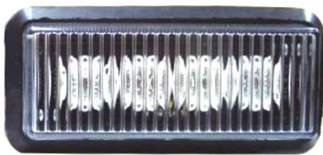
LED Modul K3/3 und K4/3