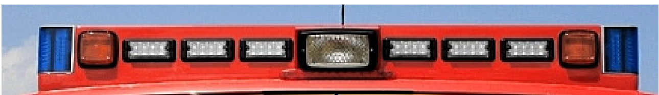
IP 8, LED Modul