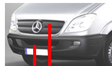
Frontbereich/verdeckten Bereich ( F/V )