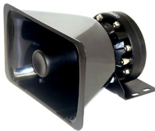
LS-YD-100 100W/8Ω 2,9 Kg