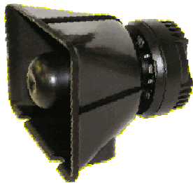
LS-100-ND 100W/8Ω 1,5 Kg