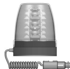
Magnet bis 280 km/h

Die LBL-20 T ist durch Ihre kompakte und robuste Bauform für den Dauereinsatz von Sonderfahrzeugen konzipiert. 12-3 Watt LED's sorgen für hervorragende Lichtwerte bei geringem Stromverbrauch. Durch die Einpunkt Gewindebefestigung oder Aufsteckrohr (DIN) Montage, eignet sie sich bestens bei wenig Befestigungsfläche. Somit ist sie auf jedem Fahrzeug einsetzbar.