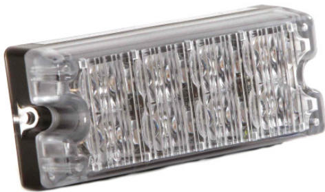
IP 8, LED Modul