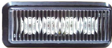
LED Modul K3/1